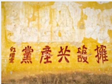
书写在曲靖市麒麟区三宝街道五联小学墙上的红色标语

军，踏上革命征程。据不完全统计，两路红军过云南共吸引数千人参加红军，增强了红军的战斗力。红军扩红的历史，就是中国共产党同人民群众生死相依、患难与共、艰苦奋斗的生动写照。金