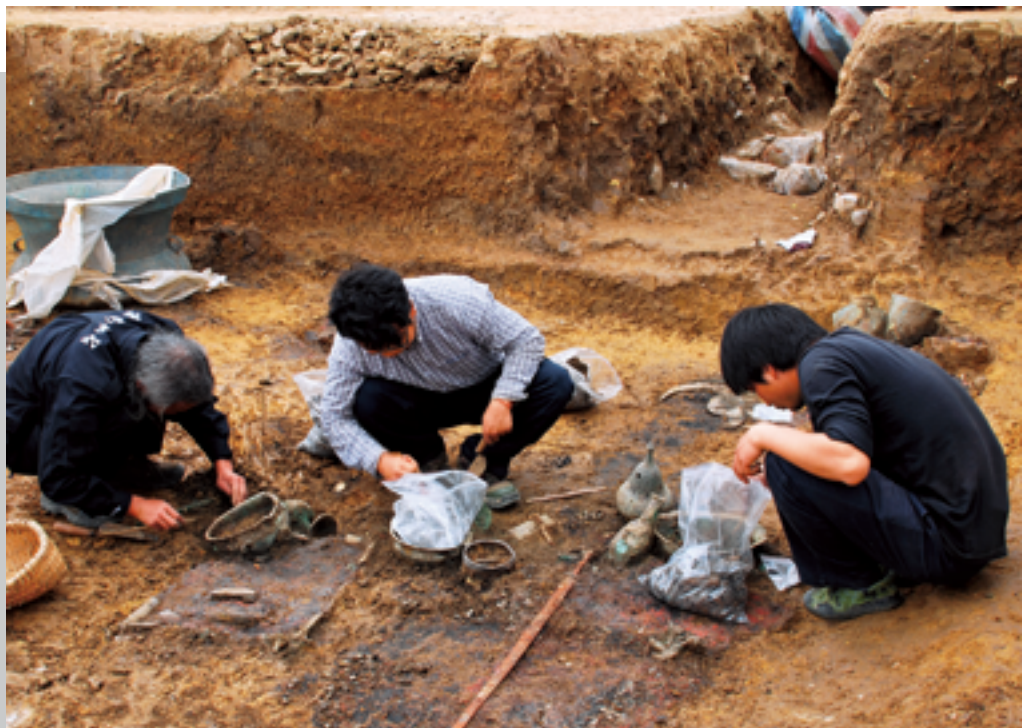
句町古墓发掘现场

封土堆墓。考古队注意到，这5座封土堆墓从墓葬规模、构筑方式、随葬品数量及等级来看，具有统一性，但其形制上存在一些差异，可能是墓主人身份、地位有别，或下葬年代稍有早晚。尽管其中3座均被盗扰，但从随葬品残片数量和精美程度上不难推测，这5座封土堆墓属于贵族甚至王族的墓葬。