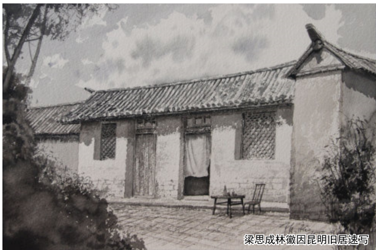
梁思成林徽因昆明旧居速写

那是幢怎样的屋子呢？1939年年中开工，次年春建成。土坯墙、瓦顶、木地板、花格窗，共八间房。住房坐西朝东，附属房坐东朝西，中间隔着一条便道，正好形成一个小小庭院。整个建筑，既融于当地乡俗，又特立独行，透出一派清雅、明净与大方。