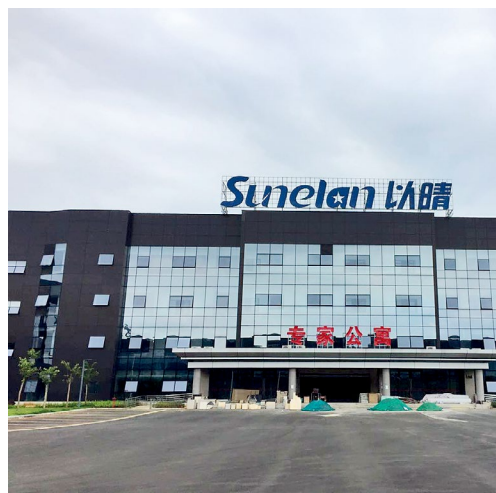
红河综合保税区内专家公寓