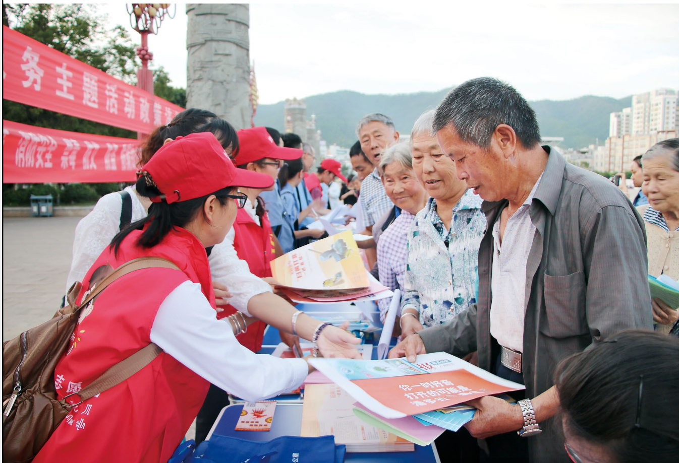
新平县锦绣社区联合共建单位党员志愿者向群众发放宣传资料