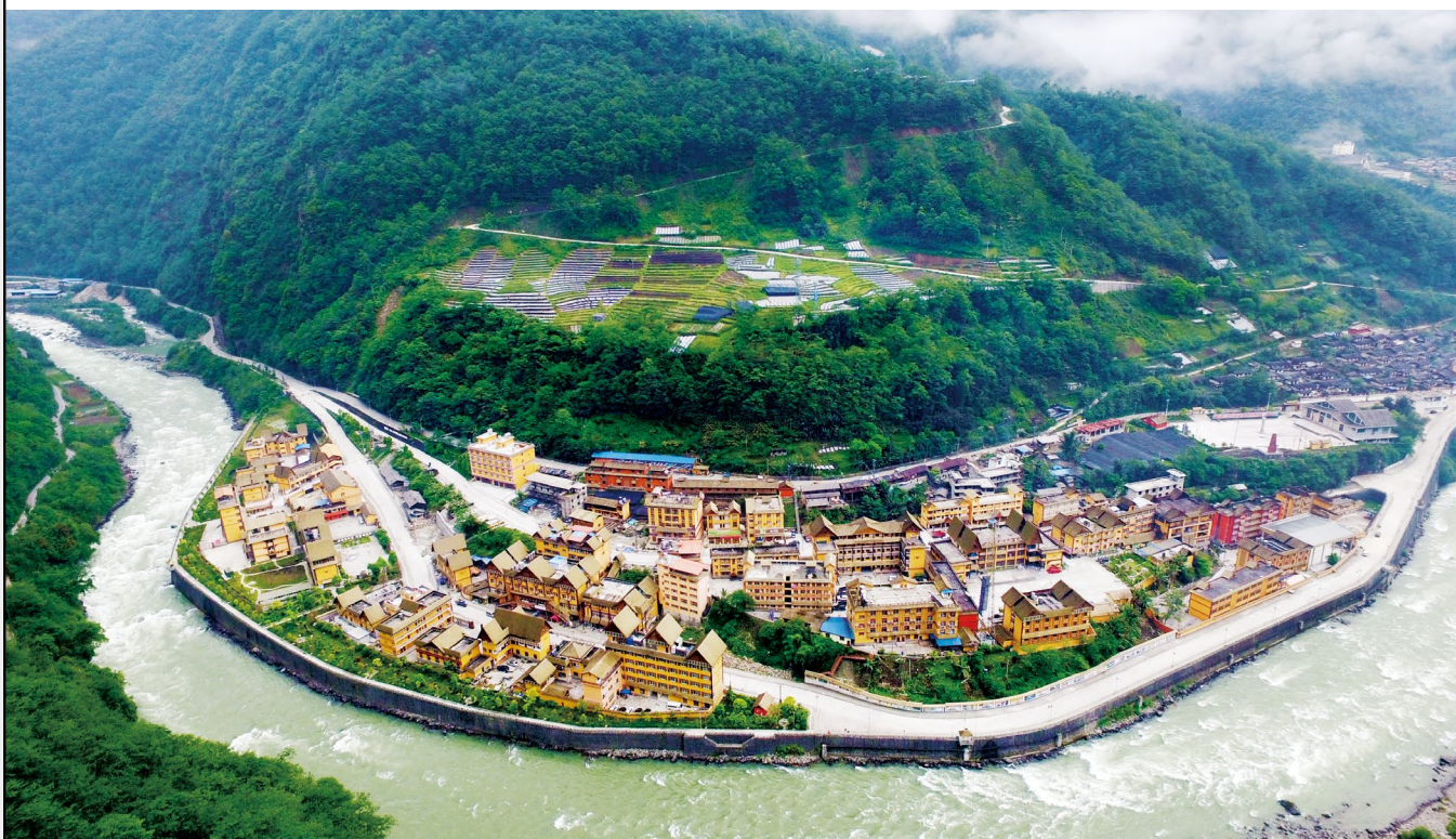
怒江州独龙江乡新貌