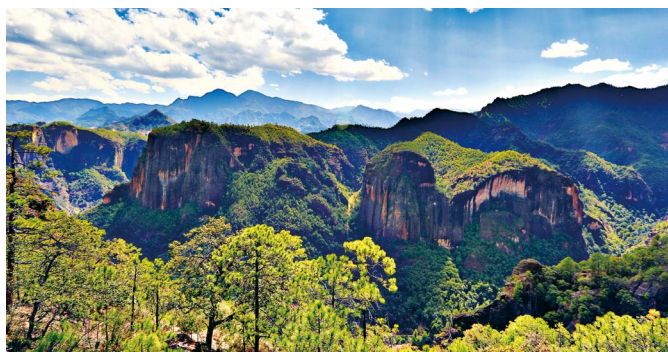
抓生态保护，图为丽江老君山黎明高山丹霞地貌 郝亚鑫