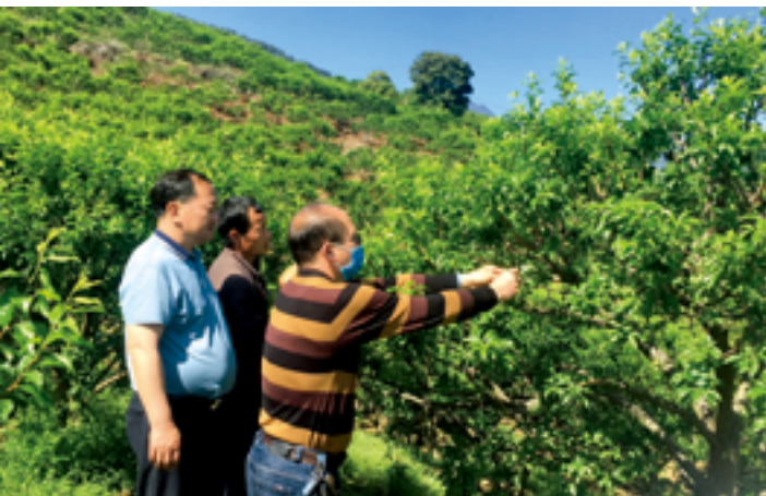
“百名专家扶百村”行动专家指导果树种植